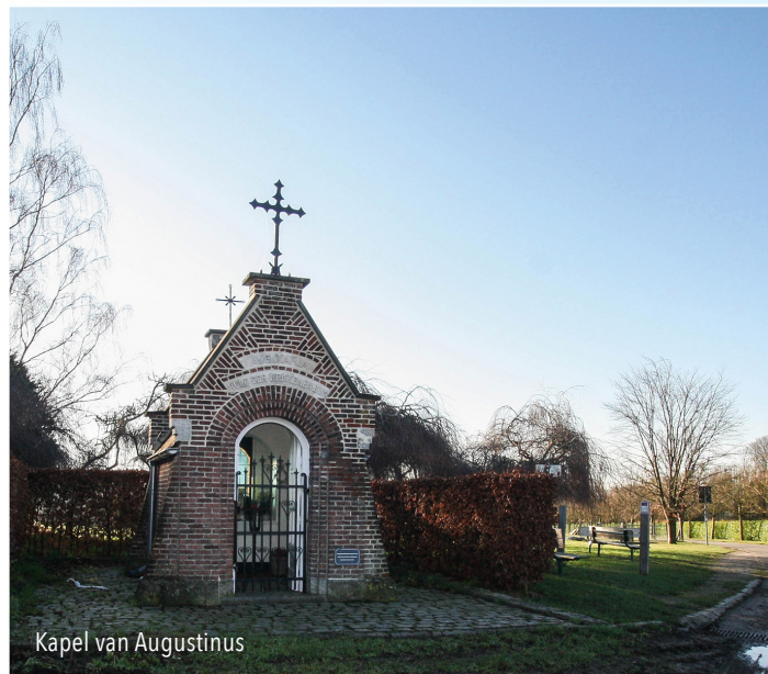
Kapel van Augustinus